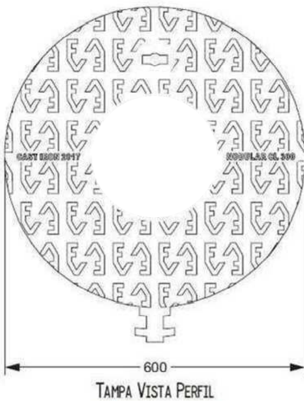
TELAR VISTA SUPERIOR